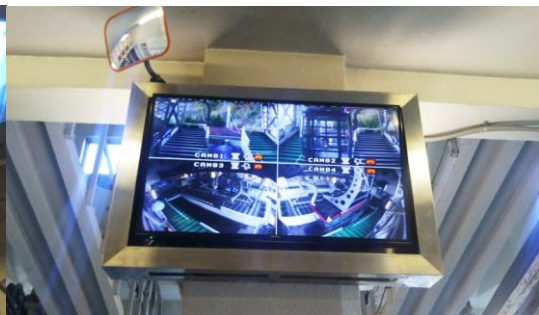
山頂ホーム設置のモニター