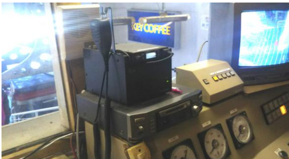
運転室内の索道無線機

搬器からお客様が降車する際、搬器が揺れるのを防ぐ為に、ガイド係りが搬器を押さえておりますが、少ない力で押さえる事が出来る背面を搬器に向けて身体で押さえる方法は、お客様が降車する様子を目視しにくい為、禁止しました。ガイド係りが搬器に向かい合う方式、搬器の横に立つ方式は可としました。（11月）