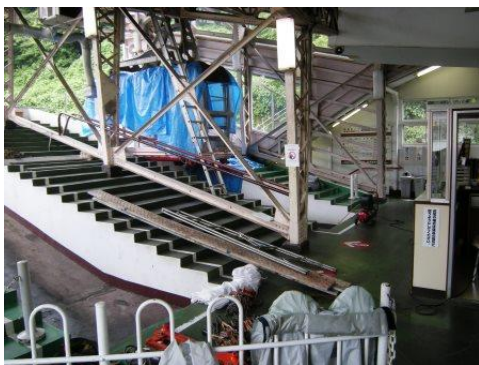
非破壊検査中の様子