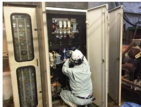
制御盤マグネット取り付け作業の様子